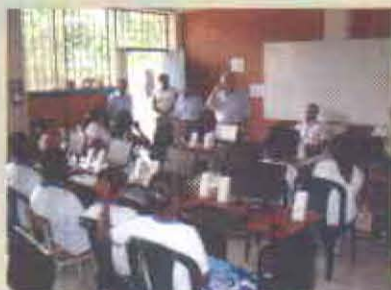
El mejoramiento de la infraestructura de las salas de informática, de los colegios articulados, fue uno de los compromisos que abanderó Fedepalma.