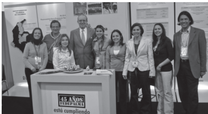
Stand y personal de Fedepalma en la primera versión de Colombia Responsable, en agosto de 2007.

El encuentro también será escenario para exponer los exitosos casos de las Alianzas Estratégicas Productivas ligadas al sector palmero; las estrategias de vinculación de la mano de obra al sector: contratos de trabajo, contratos de servicios con Cooperativas de Trabajo Asociado y otras modalidades. También se expondrán los balances sociales de estas empresas.