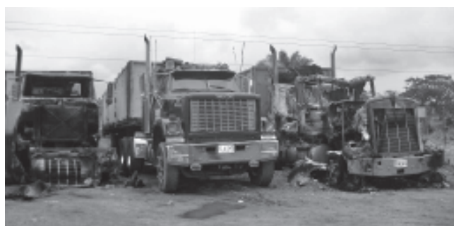
Tres de las siete tractomulas quemadas en el parqueadero de Asogpados, en el corregimiento de Campo Dos, en Norte de Santander.

do testimonios y pruebas con las cuales se pueda judicializar a los responsables de estos hechos.