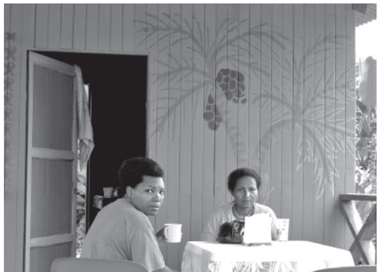
Los Principios y Criterios de la RSPO garantizan en Colombia las condiciones de trabajo conjunto entre los productores, la comunidad ambiental, las organizaciones no gubernamentales, la academia y, por supuesto, las autoridades del sector.