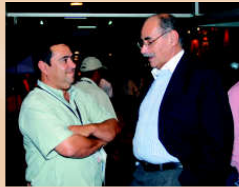
El Gobernador de Santander, Horacio Serpa Uribe, acompañó a los palmicultores del país durante el acto de instalación de los eventos gremiales.