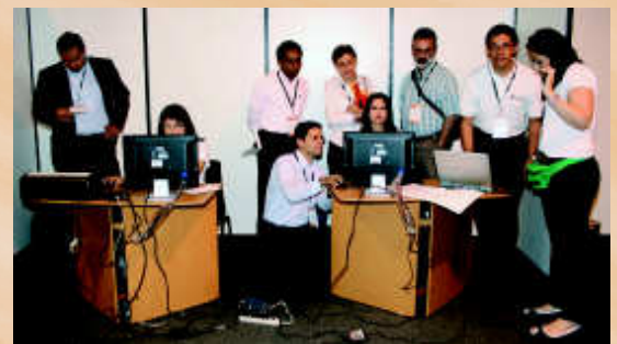
Funcionarios de Fedepalma y Cenipalma, tras bambalinas, durante los innumerables momentos de carreras y preparativos.