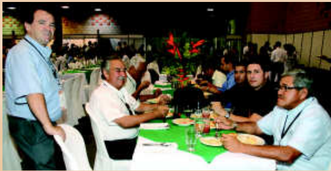
Para los palmicultores el comedor de Cenfer siempre fue un lugar de encuentro para compartir puntos de vista y el deleite de oírse almuerzos.