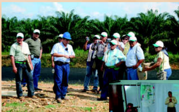
Empresarios palmeros colombianos y extranjeros, autoridades locales de municipios palmeros, periodistas y funcionarios de Fedepalma realizaron una visita a Puerto Wilches (Santander).