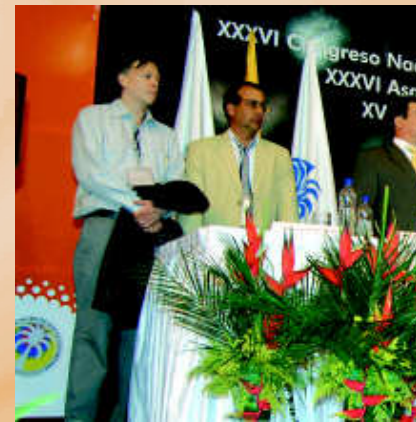
Directivos encabezados por M... de Fedepalma, invitados durante la...