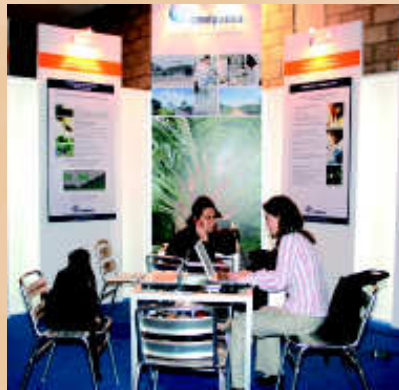
Muy didáctico estuvo el stand de Cenipalma, en el que se ilustró a los visitantes acerca de los avances en las investigaciones palmeras.