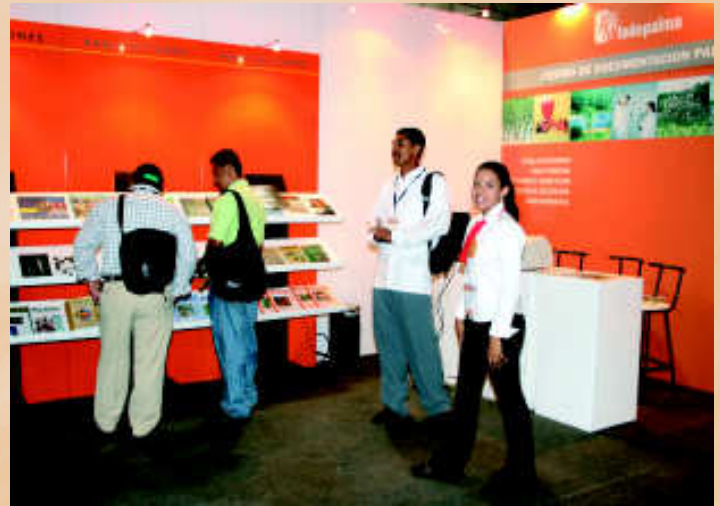
El Centro de Documentación Palmero, foco de consultas y de acopio de publicaciones, fue uno de los stand que más visitantes recibió durante los tres días de los eventos.