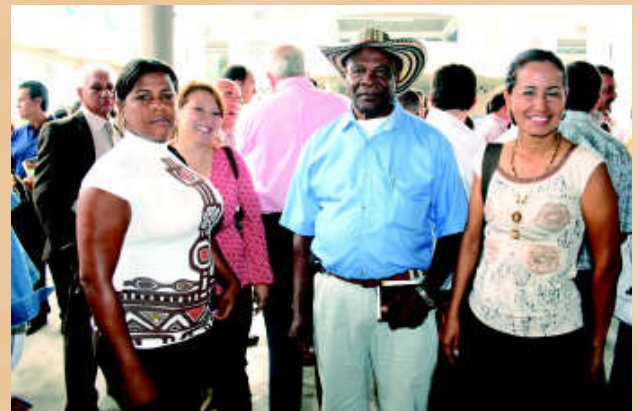
Palmicultores de todo el país asistieron con entusiasmo a los eventos mayores del sector a nivel nacional.