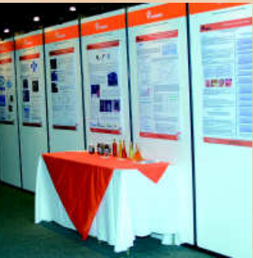
Se dividió el pasillo de acceso con el conferencista, Cenipalma exhibió en posters los resultados de sus investigaciones.