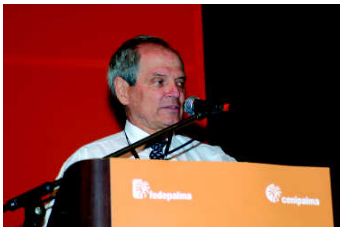
Hernán Martínez Torres, ministro de Minas y Energía, durante su intervención en los eventos gremiales.

Como un reto histórico calificó el ministro de Minas y Energía, Hernán Martínez Torres, convertir en veinte años tres millones de hectáreas que hoy se destinan a la ganadería extensiva, a la producción de etanol y biodiésel a partir de la caña de azúcar y del aceite de palma, respectivamente. La afirmación la hizo en el acto de instalación del XXXVI Congreso Nacional de Cultivadores de Palma de Aceite y la XXXVI Asamblea General de Fedepalma, que tuvo lugar en Bucaramanga entre el 27 al 30 de mayo.