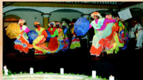
En el patio principal del Centro Cultural de Oriente, en Bucaramanga, la noche del 29 de mayo, se ofreció a los palmicultores del país un ameno y colorido acto cultural, auspiciado por palmeros de la Zona Central.