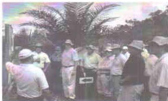
En La Vizcaína, los miembros de la Junta Directiva de Cenipalma, conocieron de primera mano los avances de este centro experimental.

La Junta Directiva se llevó la mejor impresión de la evolución que se ha logrado desde la inauguración en diciembre de 2004 y comprometió su decidido apoyo en temas de infraestruc-