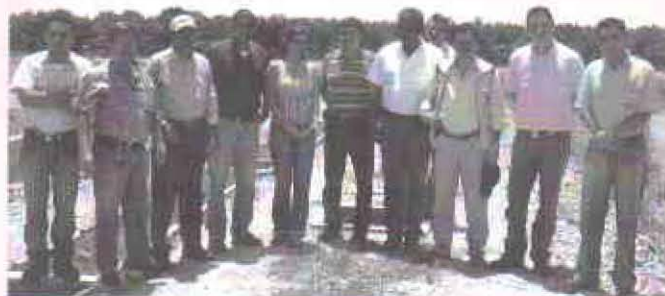
Participantes en la reunión con las autoridades ambientales de Santander.

Por acuerdos institucionales entre la nueva administración de la Corporación Autónoma Regional de Santander (CAS), las empresas palmeras con planta de beneficio de Puerto Wilches y Fedepalma, a mediados del mes de agosto de 2007 adelantaron unas jornadas de trabajo para hacer un balance de la gestión ambiental desarrollada en el marco del Convenio de Produc-