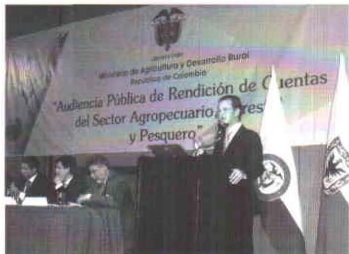
Ministro de Agricultura y Desarrollo Rural, Andrés Felipe Arias Leiva, durante la rendición de cuentas.

La idea es recuperar la tierra de la gente que se vio obligada a vender a precios irrisorios por presión de grupos al margen de la ley,