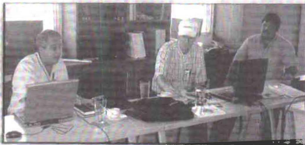
Zona Central – Comité de Mantenimiento - Campo Experimental Palmar de la Vizcaina.

Se han realizado 4 reuniones del comité asesor ➔