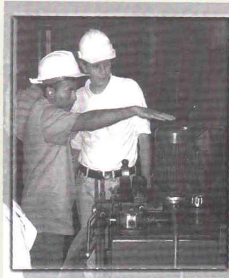
Zona Norte – Taller sobre Prensado – Palmacosta.

Con la colaboración del transferidor de la zona se han realizado 5 reuniones del comité asesor de investigación, dos visitas técnicas a las plantas de beneficio de Santa Fe y Palmeiras, además de eventos de transferencia aplicada para palmistería en las plantas de Araki, Palmeiras y Santa Elena. Se han cumplido tres talleres de transferen-