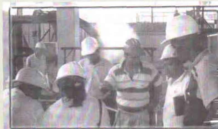
Zona Occidental – Taller sobre Palmistería – Araki.

Las actividades se han complementado con visitas