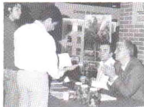
Punto de información de Hacienda La Cabaña.