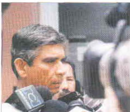
El Comandante de las Fuerzas Militares, General Jorge Enrique Mora, dialoga con los periodistas que asistieron al evento.

"Hay unos planes y unas estrategias. Si nosotros unimos todas estas cosas, seremos capaces de llegar al final del conflicto colombiano. Este optimismo que yo les transmito a ustedes, lo hago con total y absoluta sinceridad. Estoy convencido de que estamos viviendo este final, de que nosotros estamos decididos a determinar ese final".