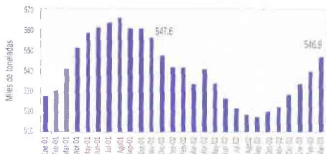
Figura 1. Evolución mensual de la producción de aceite de palma crudo 2001- 2003.

Al observar la producción anualizada de aceite de palma crudo mes a mes en la Figura 1, es evidente que la producción ya entró en una fase de recuperación sostenida. En marzo de 2003 el acumulado fue de 546.931 toneladas ligeramente por debajo del cierre de 2001 (547.571 toneladas), nivel que no se había alcanzado desde entonces.