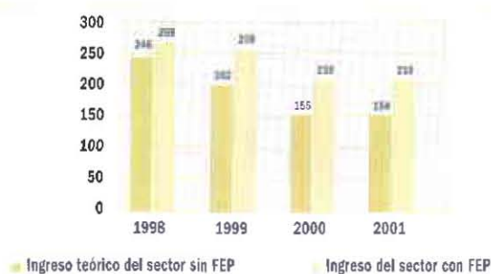
Inversión de los recursos del Fondo en la financiación de proyectos

En cuanto al aceite de palmiste si el FEP no hubiera realizado operaciones en este mercado, los palmisteros hubieran dejado de percibir la diferencia entre el precio medio de venta y el precio FOB de exportación, que equivalió a US$ 78 por tonelada de venta, lo que sumó US$ 2 millones de dólares ($ 4.600 millones) de ingreso en 2001 para el sector palmero.