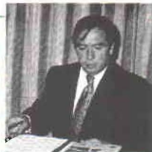
Antonio Gómez Merlano, Ministro de Agricultura.

Fedepalma, en nombre de todos los palmicultores del país resalta de esta forma la labor conjunta de los palmicultores y el Gobierno, en cabeza del Ministerio de Agricultura, para mejorar cada día más la competitividad del palmicultura colombiana.