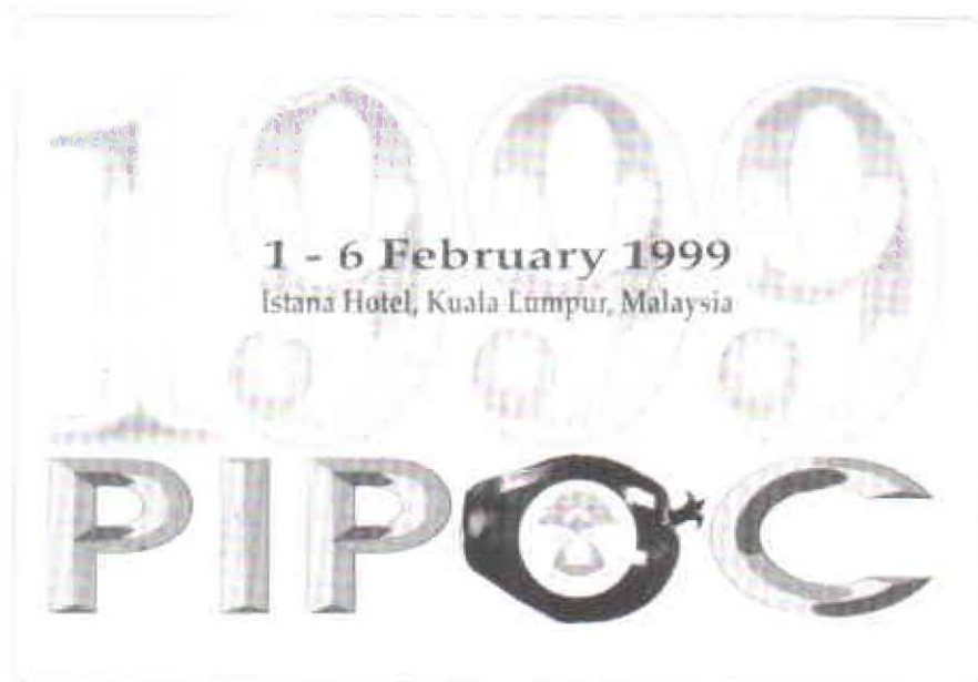
Afiche publicitario del evento.

A lo largo de este año, El Palmicultor le estará ofreciendo información sobre este evento, que se llevará a cabo del 1 al 6 de febrero de 1999 en Kuala Lumpur, Malasia.