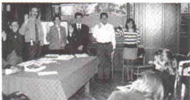
Los funcionarios elegidos en la nueva Junta Directiva del Fondo de Empleados toman juramento

El pasado 27 de febrero se llevó a cabo la tercera asamblea de asociados del Fondo de Empleados de Fedepalma, entidad que ha tomado gran auge en este último año. El número de asociados durante el período se incrementó 30% pasando de 53 asociados a enero de 1997 a un total de 69 asociados al cierre del ejercicio, todos empleados de las entidades gremiales, Fedepalma, Cenipalma y C.I Acepalma S.A.