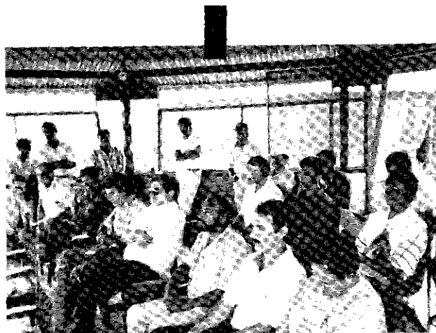
En la gráfica superior, científicos observan una palma con sagalassa . Abajo, en la plantación Salamanca.