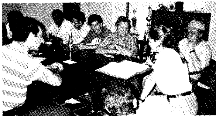
Aspectos de la reunión para la evaluación de sagalassa valida .