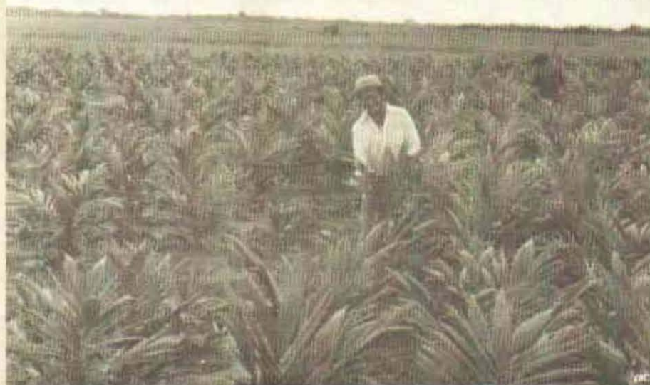
PARTICIPANDO EN EL DESARROLLO AGRICOLA DEL LLANO

Calle 54 No. 10-81. Piso 7o. Tels.: 2854358 - 2116823 Apartado Aéreo 13773 Bogotá - Colombia