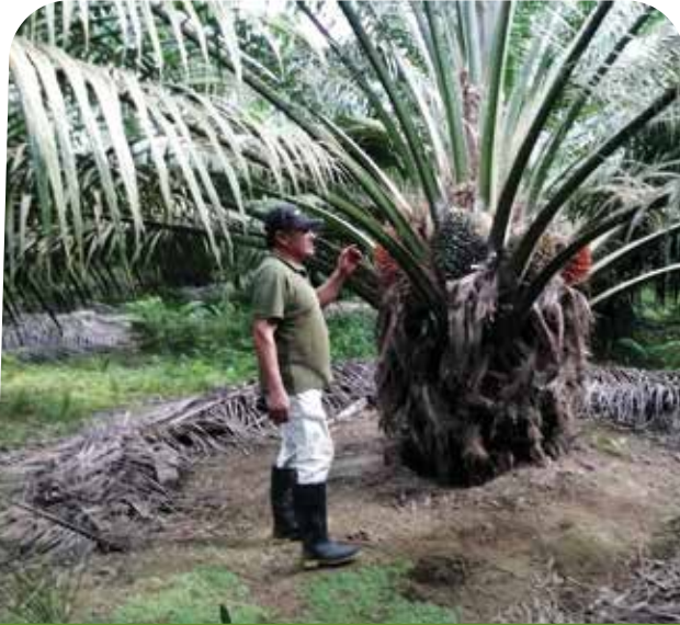
La finca La Pastrana, ubicada en Urabá, Antioquia, adopta las buenas prácticas agrícolas para mejorar su producción

Por: Adolfo J. Nuñez Polo Extensionista de la Zona Norte