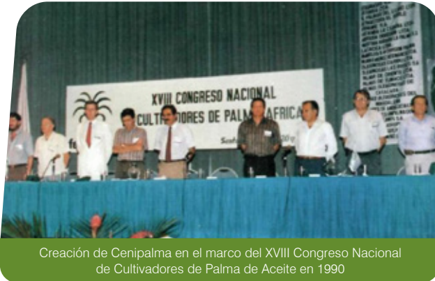
Creación de Cenipalma en el marco del XVIII Congreso Nacional de Cultivadores de Palma de Aceite en 1990