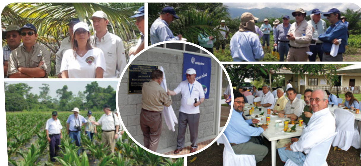
Acompañamiento de la Junta Directiva en diferentes actividades organizacionales