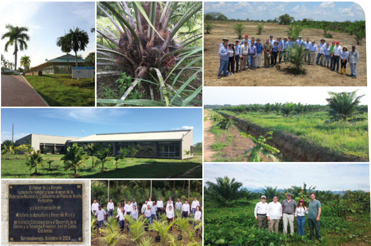
El desarrollo institucional también se evidencia en los diferentes Campos Experimentales de Cenipalma

En 2019 Cenipalma logró el reconocimiento de Colciencias como Centro de Investigación, otorgado por 5 años mediante la resolución 1538 del 2 de octubre, que destaca la estrategia de trabajo como coherente y pertinente, las actividades acordes con las líneas de investigación definidas y el objeto social del centro enfocado en el desarrollo de los objetivos estratégicos.