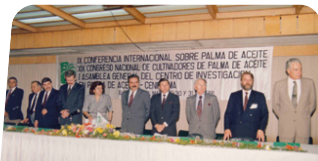
Instalación de la I Asamblea General de la Corporación Centro de Investigación en Palma de Aceite, Cenipalma, en 1991

El XVIII Congreso Nacional de Cultivadores de Palma de Aceite en su sesión del 22 de septiembre de 1990 creó la Corporación Centro de Investigación en Palma de Aceite, Cenipalma, como una corporación de carácter científico y técnico, sin fines de lucro, cuyo propósito es generar, adaptar y transferir tecnología en el cultivo de la palma de aceite, su procesamiento y consumo. El Centro inició su vida jurídica el 1 de enero de 1991 y en el mes de mayo de ese año se llevó a cabo su primera Asamblea General.