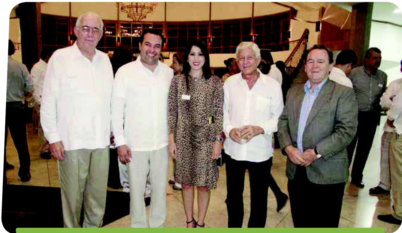
La Reunión Gremial de Santander se realizó en el Club campestre de Bucaramanga.

En el evento, el Gobernador de Santander destacó a Fedepalma como uno de los gremios más comprome-