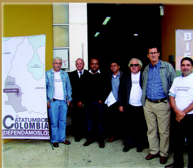
Ante la preocupación expresada por Fedepalma entorno a la situación de orden público en el Catatumbo y en particular de los palmicultores de la región, se llevó a cabo, en el marco de Agroexpo 2013, el “Foro sobre el Catatumbo: problemática actual y potencial de desarrollo agropecuario”.