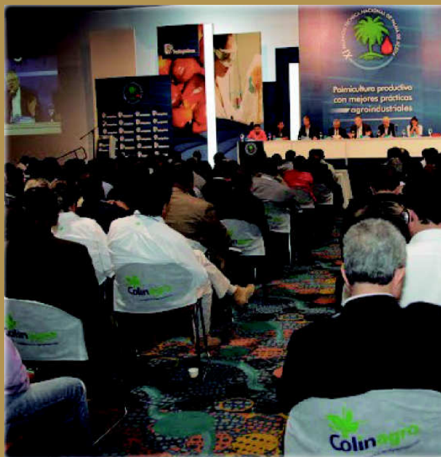
Más de 1.000 personas asistieron al evento académico más representativo del sector palmero, la XI Reunión Técnica Nacional en Palma de Aceite, que se llevó a cabo en el mes de septiembre.