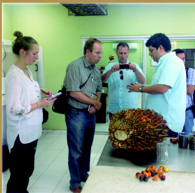
Invitados por Fedepalma y con el apoyo de Proexport Colombia, tres periodistas europeos, dos alemanes y una británica, visitaron el país por una semana, con el propósito de conocer más sobre la agroindustria de la palma de aceite.