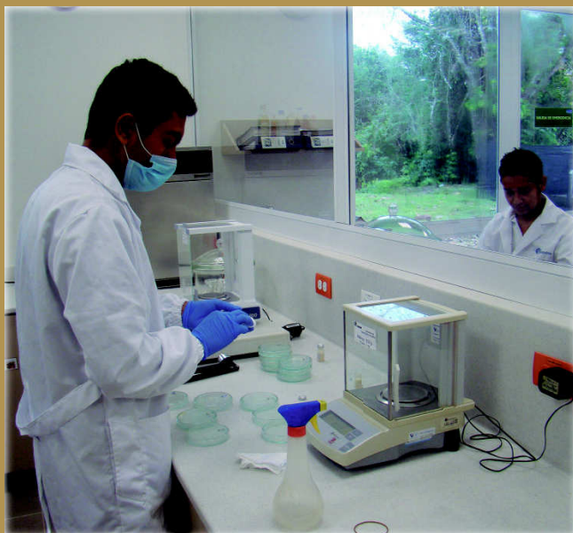
El módulo de biotecnología fue inaugurado por Cenipalma-Fedepalma en el Campo Experimental Palmar de La Vizcaína, en Barrancabermeja, con el objetivo de que la investigación sobre la palma de aceite en Colombia alcance nuevos niveles y mejores resultados, a partir de todas las tecnologías modernas de investigación.