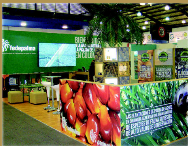
Del 11 al 21 de julio se realizó la décimonovena versión de Agroexpo 2013 en el Centro Internacional de Negocios y Exposiciones de Bogotá –Corferías, evento que reunió en un solo lugar la mayor oferta agrícola, pecuaria y agroindustrial de América Latina, Región Andina, Caribe y Centroamérica. El stand de Fedepalma tuvo un área de 59 m 2 y una palma artificial de 4 m de altura, tronco y frutos armado con 16 módulos de exhibición.