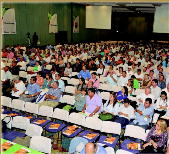
El XLI Congreso Nacional de Cultivadores de Palma de Aceite convocó a más de 1.000 personas provenientes de las distintas zonas palmeras del país. Un espacio para la reflexión y el diálogo entre Gobierno, Congreso de la República y empresarios. Foto: Toro, F., Santa Marta, 2013.