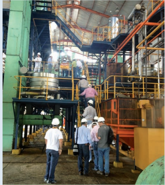
Panorámica de la Planta de Extractora Central, uno de los sitios escogidos para las visitas tecnológicas precongreso.

“La visita fue todo un éxito tanto desde el punto de vista técnico como logístico ya que los asistentes se interesaron mucho en los indicadores de producción de la planta de beneficio y en las condiciones de seguridad y aseo con que cuentan. Es de resaltar los buenos resultados que se han tenido históricamente en la extractora lo cual, como se discutió en el evento, es la suma de “pequeños” detalles durante todo el proceso”, indicó Diego Nieto. De igual forma, fue satisfactorio saber que Extractora Central ha tenido en cuenta las recomendaciones y manuales de Cenipalma relacionadas con la mejores prácticas durante el proceso de extracción del aceite. Se adelantó el recorrido por cada una de las secciones de la planta desde la recepción de fruto hasta la generación de vapor, finalizando con una visita al sistema de tratamiento de efluentes. Por último se hizo una retroalimentación a la planta de beneficio de Extractora Central S.A. con una reunión en la cual los asistentes expresaron sus opiniones sobre el manejo de la planta y sus datos históricos de producción.