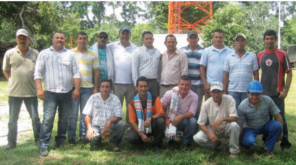
Grupo de propietarios de El Palmar en Sabana de Torres Santander, proyecto que contó con el respaldo de Indupalma y que les dio la posibilidad a estos campesinos de convertirse en empresarios palmeros.