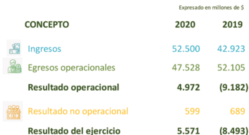
Tabla 3. Estado de resultados integrales de la cuenta de Fondo de Fomento Palmero.

En 2020, el resultado neto del ejercicio de la cuenta FEP Palmero aumentó 129 % respecto al año anterior, sin embargo, este está afectado por la temporalidad del movimiento de cesiones y compensaciones, las cuales disminuyeron respecto a 2019.