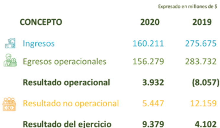
Tabla 5. Estado de resultados integrales de la cuenta de FEP Palmero.