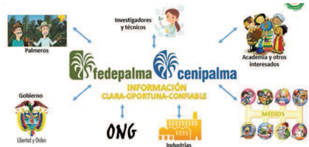
Figura 1. Principales agentes de interacción del sector palmero para la generación de información.

Los productos de las anteriores fuentes de información son analizados y puestos a disposición a través de dos sistemas de información: el Sispa y el CID Palmero, los cuales son fuente y repositorio de información que apoya la generación y difusión de publicaciones como el Boletín Estadístico del Sector Palmero, el Anuario Estadístico, el Informe Diario de Precios y Mercados, el Boletín Mensual de Comercialización, el estudio de costos, el boletín