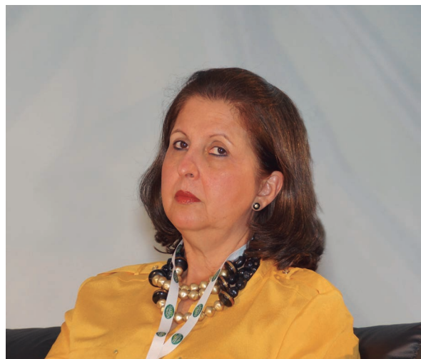
La Senadora Nora García Burgos invitó a los palmicultores a exponer sus inquietudes ante la Comisión Quinta.

Otro tema, asistencia técnica. ¿Cómo vamos a entregarles $ 200.000 millones a 600 alcaldes para que presten asistencia técnica?, ¿qué alcalde en este país sabe prestar asistencia técnica de palma? Por Dios, eso es absurdo, eso es votar el dinero. Yo creo que el Congreso va a tener que comenzar a trabajar el tema de la asistencia técnica y buscar un mecanismo que